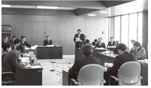
議場風景 (富士市役所9階第二委員会室)

ポンプ場に設置してある4台の主ポンプは、10年ごとに分解点検整備を行っていますが、今年度は1号主ポンプの定期点検を行います。天井クレーンの更新工事は、現状の手動式走行クレーンを電動式に更新し、併せて耐震化を図るものです。