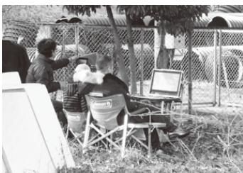
撮影現場をモニターでチェック