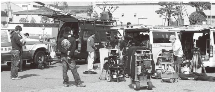
機材の準備をするスタッフ