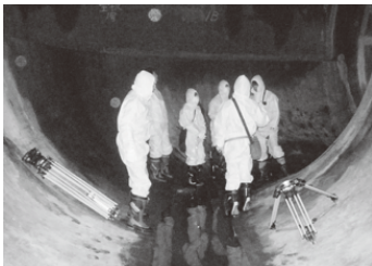
幹線排水路内で撮影準備

岳南排水路の幹線(富士市鈴川地先)で、3月1日、8日、10日の3日に亘りテレビドラマ「シバトラススペシャルII」のロケーション撮影がありました。富士市では観光交流振興の施策として、市民活動(NPO法人)による、ロケーションの誘致を進めています。今回、「NPO法人フィルムコミッション富士」の仲介により、テレビ局が撮影に来富しました。総勢40名余のスタッフが、13台もの車で機材と共に到着し、エキストラも加わって、活気のある撮影でした。