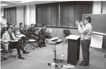
説明を聴く参加者

※使用者の皆様へお願い 排水が流せない期間中は、工場内の排水や雨水が排水路に流れ込まないように、関係部署に周知いただきたく、お願い申し上げます。 また、昨年の排水が流せない期間中に富士市環境保全課へ、臭気の苦情が数件寄せられましたので、臭気対策を講じていただきますよう、併せてお願い申し上げます。