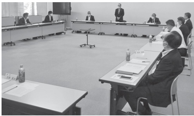
運営委員会の様子

令和3年2月8日(月)の管理組合議会定例会で可決された令和3年度管理組合会計予算について報告しました。概略は下表のとおりです。