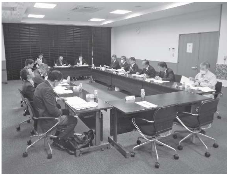
運営委員会の様子