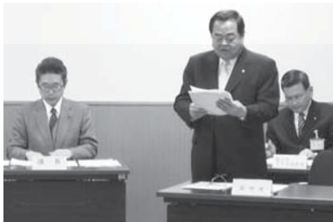
管理者（富士市長 鈴木 尚）大綱説明

平成25年2月5日（火）午前10時から管理組合庁舎2階会議室において、岳南排水路管理組合議会定例会を開催しました。上程した議案は、平成25年度会計予算と平成24年度会計補正予算、条例改正2件の計4件です。