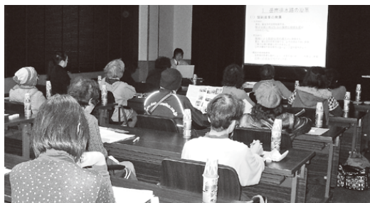
熱心に説明を聴く見学者

富士市消費者運動連絡会が施設見学 11月19日(火)、施設見学として富士市消費者運動連絡会の方々が来所しました。 当日は、映像を交えた説明で建設経緯や施設概要などに理解を深めていただいた後、ポンプ場設備などを見学していただきました。