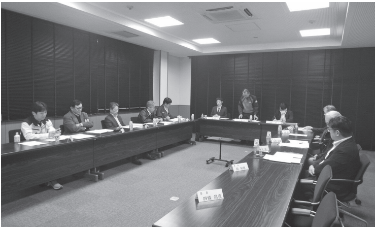
運営委員会の様子