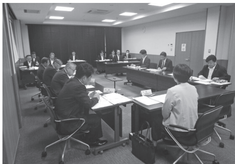
議 場 風 景

令和7年度会計補正予算 令和7年度会計補正予算は歳入歳出予算に789万円を追加し、5億7,189万円となりました。 これは、歳入において前年度繰越金を増額し、歳出において一般管理費を増額したことによるものです。